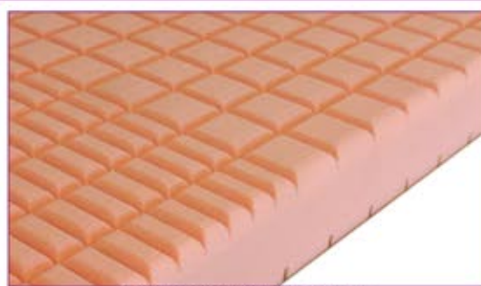
Pasivní antidekubitní matrace