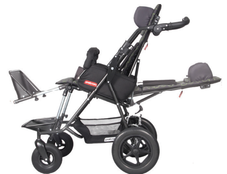
plně polohovatelný kočárek